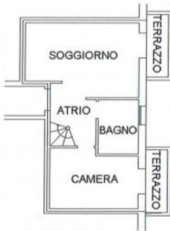
PIANTA PIANO PRIMO H= 2.70 m